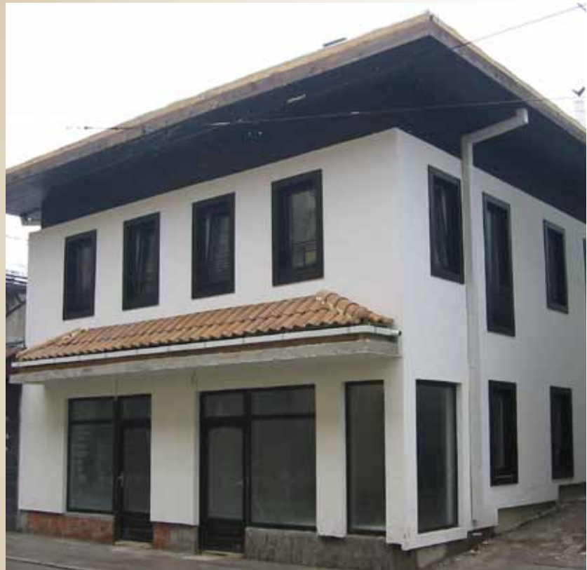
Objekat u Besarinoj čikmi

Jedan od kapitalnih projekata Općine Stari Grad Besarina čikma završen je u januaru mjesecu ove godine. Investitor radova Boosline d.o.o preuzeo je obavezu i izgradio jedan stan koji će vlasnica moći otkupiti (45m 2 ), s obzirom da je tu i ranije živjela u starom i ruševnom stanu i posjeduje sva prava. Osim toga, investitor je izgradio i četiri poslovna prostora (dva za Općinu, dva za investitora), čime se dobio potpuno nov objekat sa novom infrastrukturom i riješilo se pitanje jednog nosioca stanarskog prava. Vrijednost radova je 246.146,13 KM.