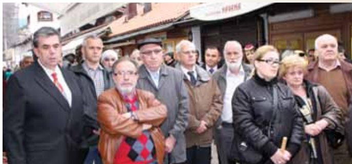
Brojni gosti na otvaranju