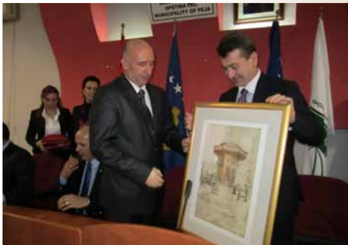
Načelnik uručuje prigodan poklon