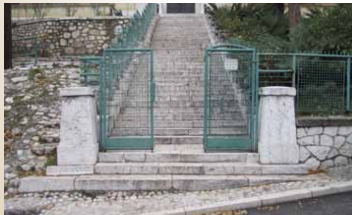
Stepenište u ulici Sagrdžije

Urađena je sanacija stepeništa u ulici Sagrdžije , izgradnja stepenika i trotoara. Vrijednost investicije cca 3 000 KM.