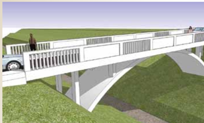
Obhodža: Bijeli most