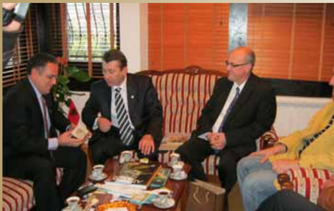
Posjeta u novootvorenoj albanskoj ambasadi