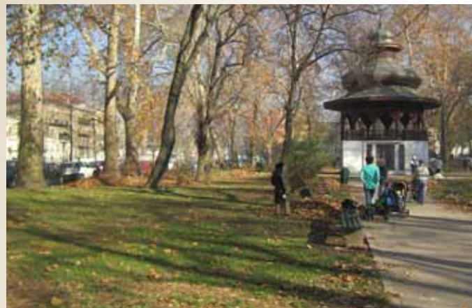
Park At mejdan

100.000,00 eura Turska vojna misija izdvojila je za rekonstrukciju parka At mejdan, kod Muzičkog paviljona, za što im je već obezbijedena potrebna dokumentacija i radovi bi uskoro trebali početi.