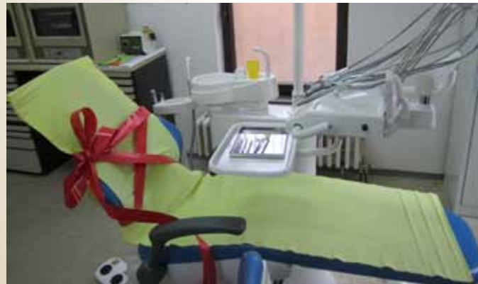
Donirana stomatološka stolica