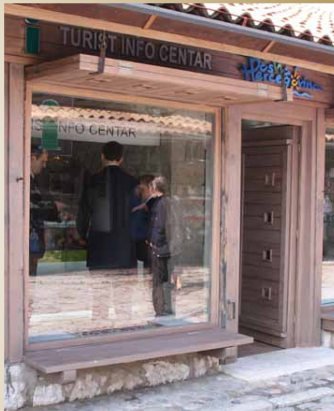
Info punkt u Saračima

Cilj je, putem propagandnog materijala, pokazati stranim i domaćim turistima šta sve Sarajevo nudi, te dati informacije o smještajnim kapacitetima, šta turisti i gdje mogu posjetiti, šta se dešava u gradu. To prvi kontakt turista sa gradom, a na ovom mjestu u srcu Baščaršije, u srcu Sarajeva, posjetilac će dobiti najkvalitetnije i najbitnije informacije.