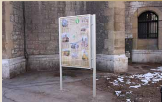
Info pano kod Katedrale