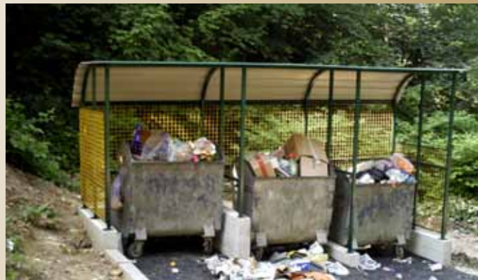
Nalina preko puta br. 21