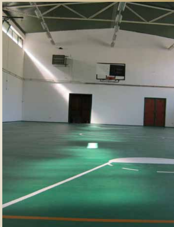
Fiskulturna sala OŠ „Vrhbosna“