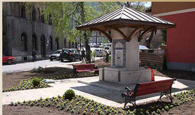
Osman Gazi-Bursa sebilj