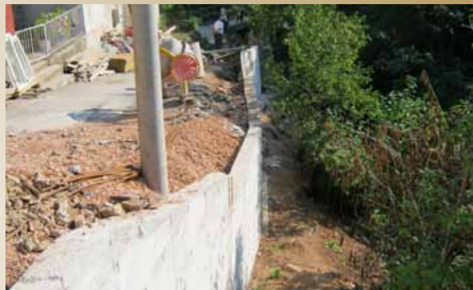
Ramića banja 11

U toku ove godine, Općina Stari Grad je finansirala sanaciju i izgradnju potpornih konstrukcija: Ramića banja 11 (29.950,00 KM), Ramića banja 34 (24.732,79 KM), Bostarići (24.752,68 KM), Žagrići (11.477,70 KM), Dolovi (25.757,55 KM), Ispod oraha (8.974,73 KM), Jarčedoli (31.100,00 KM), Turbe 7 (14.505,78 KM) i Maguda 1 (34.430,14 KM) Vrijednost investicije cca 189.500 KM.