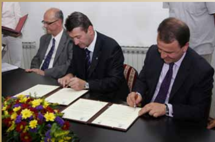
Potpisivanje sporazuma sa općinom Silivri