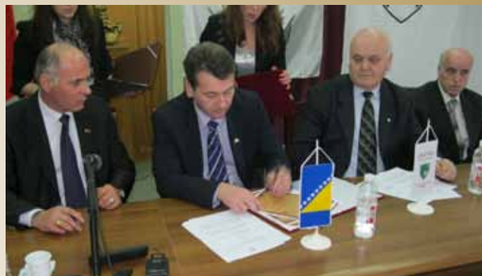
Potpisivanje sa Općinom Peć (Kosovo)