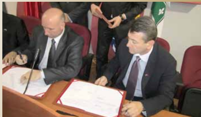
Potpisivanje sa Općinom Kruja (Albanija)