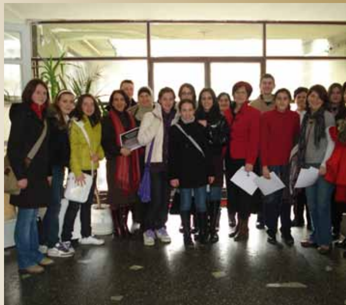
Takmičenje iz geografije