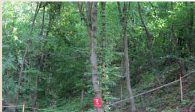
Deminirano područje na Faletićima

5. U toku izvještajnog perioda Služba civilne zaštite Općine Stari Grad je napravila i Elaborat o skloništima na području naše Općine. Iz sredstava civilne zaštite finansirana je i adaptacija skloništa u ulici Dženetića čikma br.14.