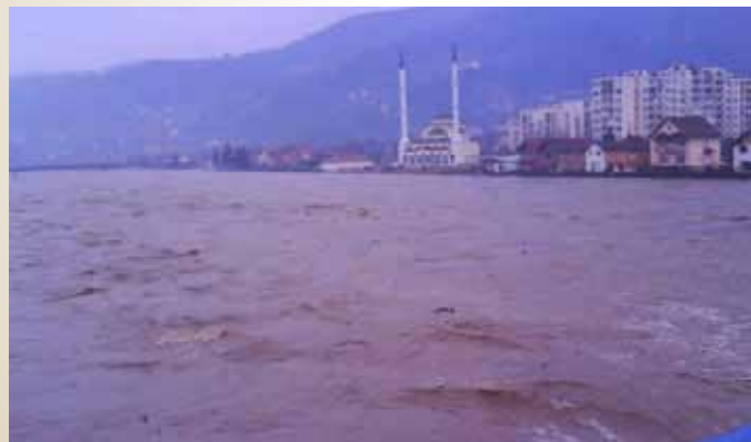
Nabujala rijeka Drina