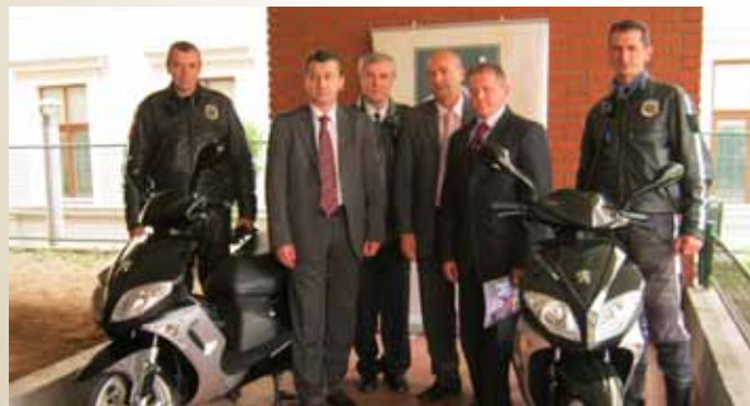
Dodjeljeni motocikli PS Stari Grad