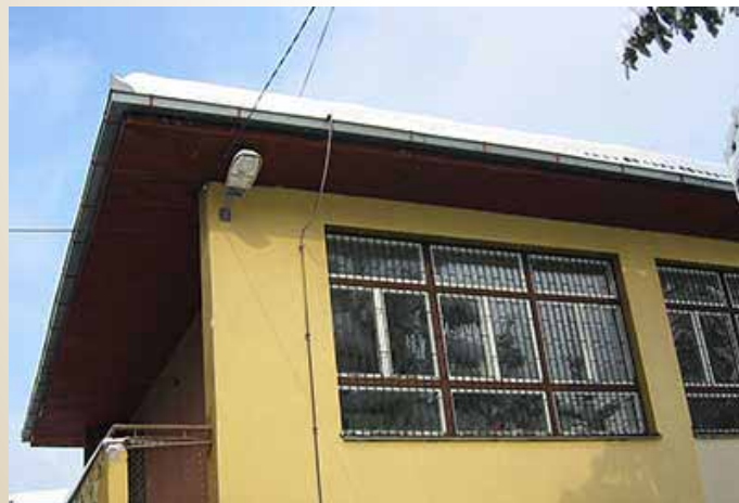
Postavljena rasvjeta u dvorištu OŠ Saburina