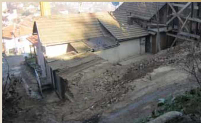
Mjesto na kojem je bio objekat u ul. Velika Berkuša

Srušen je objekat u ulici Velika Berkuša br. 5 koji je predstavljao opasnost po život i zdravlje ljudi, okolne građevine i saobraćaj. Troškove rušenja u iznosu od 20.9443,00 KM plaća Općina, a na teret vlasnika objekta.