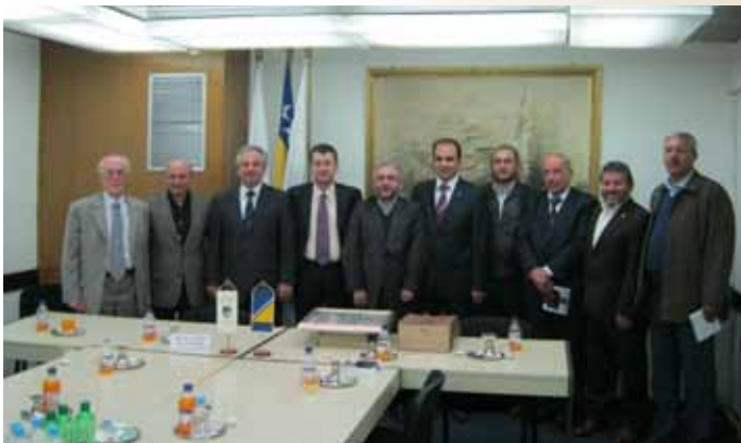
Delegacija Općine Konja (Turska)