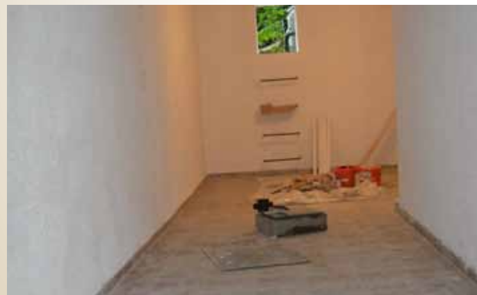
Dženića čikma br.14

Završena je sanacija skloništa u ulici Dženića čikma br.14. Realizaciju projekta u iznosu od 13.963,84 KM finansirala je Općina