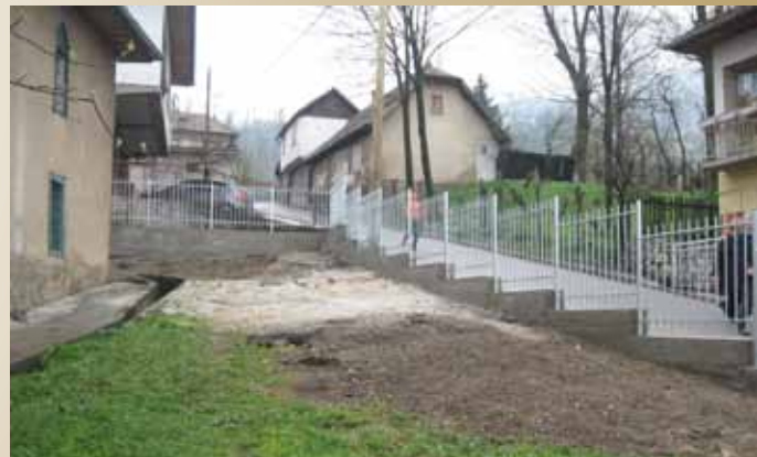
Džamija u ulici Nalina

Postavljena je metalna ograda oko džamije u ulici Nalina, dužine 54 m, a visine 110 cm. Izvođač radova je Fadž-Company, a vrijednost projekta u iznosu od 17.836,29 KM finansirala je Općina Stari Grad Sarajevo.