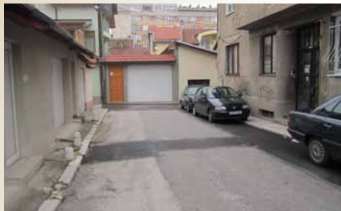
Ulica Avdage Šahinagića

Urađena je sanacija asfaltne površine i sanacija rova i prelaza u ulici Avdage Šahinagića. Vrijednost investicije je bila 4.141,98 KM.