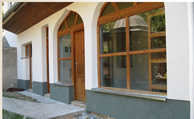
Nova fasada na džmiji Obhodža

Općina Stari Grad Sarajevo finansirala je postavljanje fasade na džamiji Obhodža, Mjesna zajednica Mošćanica. Na džamiji je urađena kompletna termo fasada. Realizator projekta je Medžlis Islamske zajednice, a finansirala ga je Općina Stari Grad u vrijednosti od 14.000,00 KM.