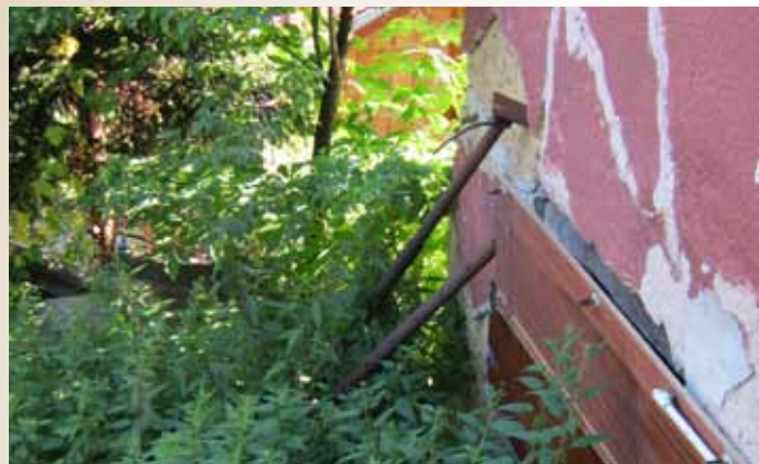
Jedan od ojekata u ulici Pastrma

Projekat sanacije klizišta Pastrma 22 finansiraju Zavod za izgradnju Kantona Sarajevo i Općina Stari Grad. Vrijednost ugovorenih radova je 135.000,00 KM.