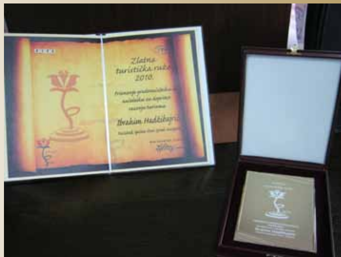
Nagrada „Zlatna turistička ruža 2010.“

2010.“, manifestacija dodjeljivanja priznanja u turizmu, održana je u Brčkom 25.09.2010. godine, pod sloganom „Osmijeh za BiH“.