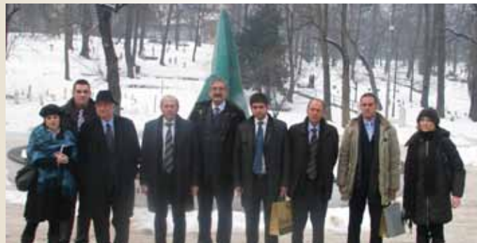
Delegacija iz Italije posjetila Spomenik ubijenoj djeci Sarajeva