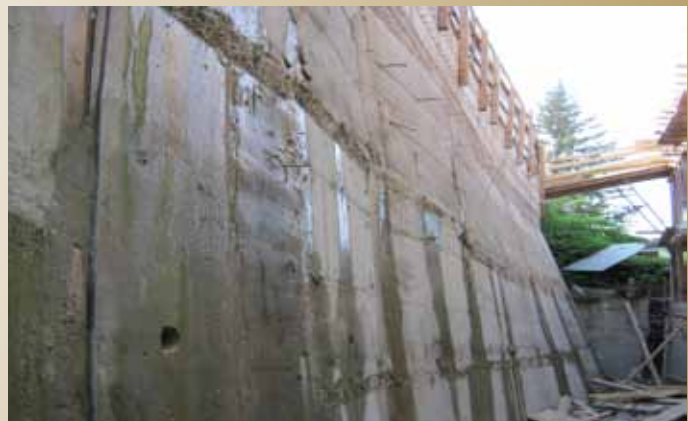
Potporni zid u Prijepoljčevoj

U ulici Prijepoljčeva, iznad lokaliteta Potok br.24, gdje se gradi objekat instituta IBN SINA za Ambasadu Islamske Republike Iran, izvršena je sanacija klizišta, osiguranje padine i obezbjeđenje saobraćajnice. Općina Stari Grad je sufinansirala sanaciju klizišta sa 60.000,00 KM, dok je vrijednost investicije iznosila 196.000,00 KM.