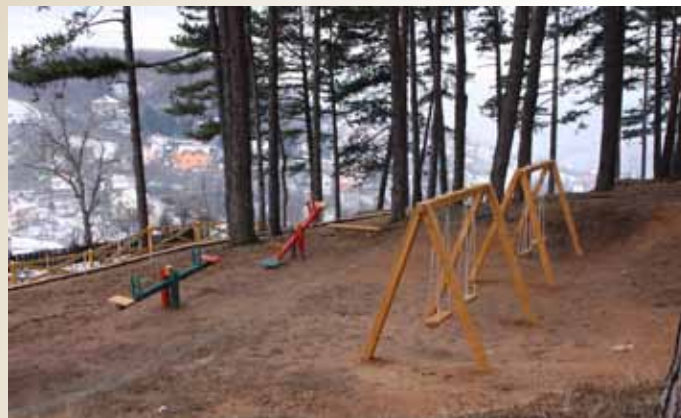
Popov gaj: Dječije igralište (ljudjačke i klackalice od drveta)