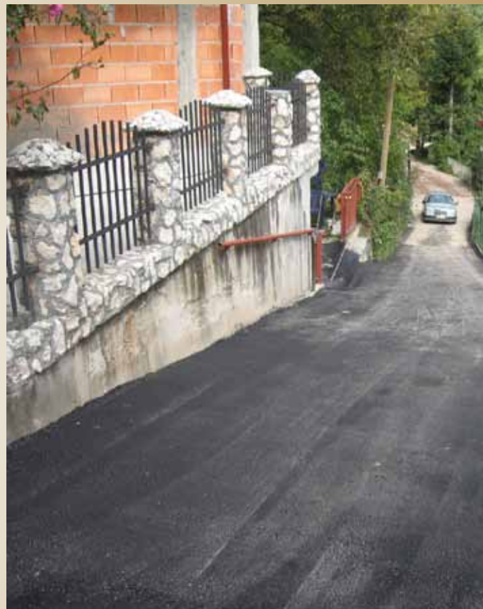
Zmajevac - Sarajevskih Gazija

Općina Stari Grad, Direkcija za ceste Kantona Sarajevo i KJKP „Rad“ potpisali su Anex na već postojeći Ugovor o izvođenju radova na ljetnom održavanju cesta na području Kantona Sarajevo za period od 15.03. do 15.11.2010. godine. Pomenutim ugovorom, obuhvaćena je sanacija kolovozne konstrukcije Zmajevac - Sarajevskih Gazija dužine 273 metra i sanacija udarnih rupa u ulicama Mehmedagina i Alije Nametka. Realizaciju cjelokupnog projekta, u vrijednosti od 42.861,19 KM, finansira Općina Stari Grad.