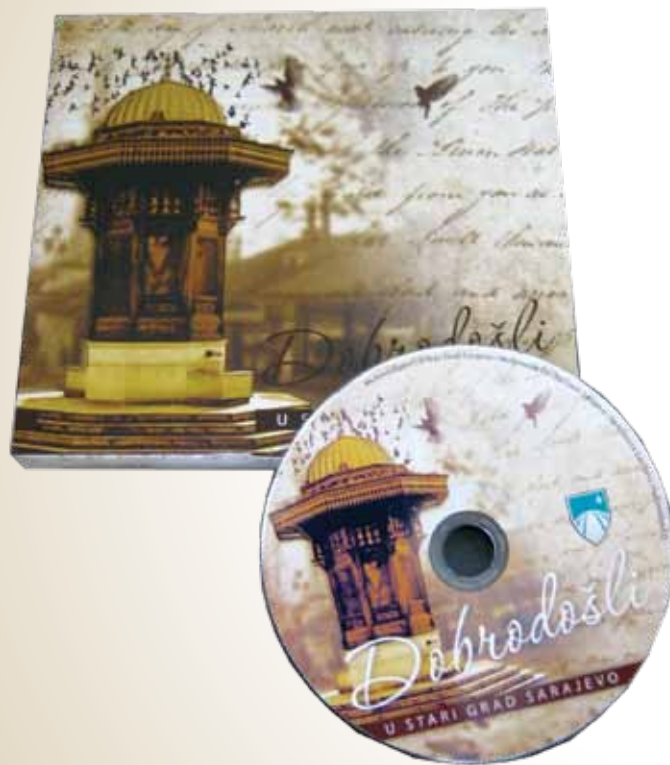
Izgled multimedijalnog CD-a “Dobrodošli u Stari Grad”

Nakon predstavljanja zvaničnog suvenira Starog Grada, „Sarajevske kocke“, nastavili smo aktivnosti u cilju promocije Općine Stari Grad i njenih kulturno-historijskih znamenitosti. 08.jula 2010. godine je zvanično predstavljen Multimedijalni CD „Dobrodošli u Stari Grad“. CD sadrži: historijat Sarajeva, virtual tour, promotivni film „Dobrodošli u Stari Grad“, Info kiosk, Film „Sarajevska kocka“, te Fotogaleriju Stari Grad nekad/sad. Multimedijalni CD „Dobrodošli u Stari Grad“ je trojezičan i svi sadržaji su na bosanskom, engleskom i turskom jeziku.