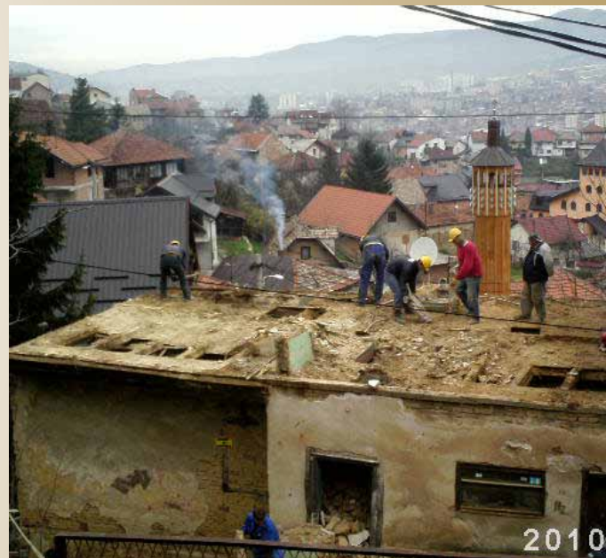
Ruševni objekat u ulici Velika Berkuša br. 5

Pored navedenog u saradnji sa ostalim službama Općine Stari Grad Sarajevo u mjesecu novembru 2010.godine učestvovali smo u organizaciji i izvršenju rušenja ruševnog objekta u Ul. Velika Berkuša br. 5 od kojeg je prijetila opasnost po život i zdravlje ljudi, okolne objekte i saobraćaj.