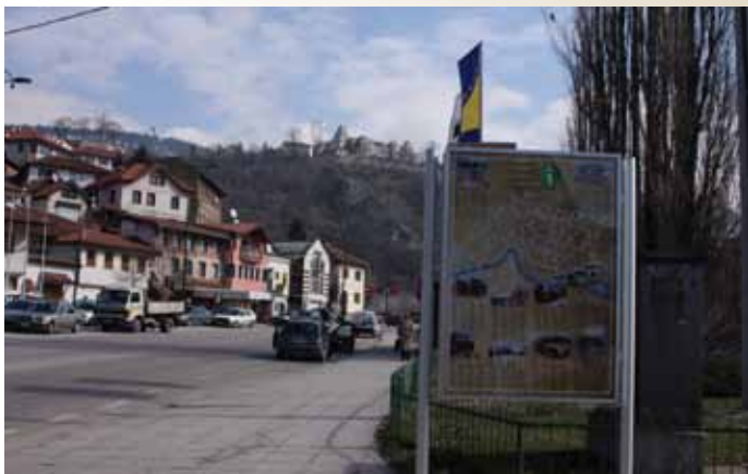
Info pano kod Vijećnice