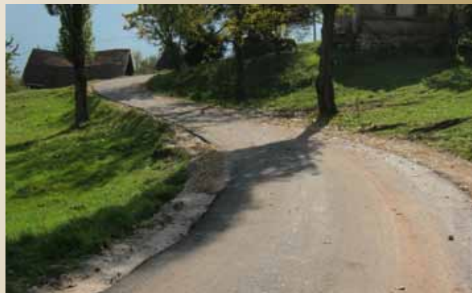
Streljačka - Hladihode

Naime, Općina Stari Grad, Direkcija za ceste Kantona Sarajevo i KJKP „Rad“ potpisali su Ugovor o sanaciji kolovozne konstrukcije sa udarnim rupama na dionici ulice Streljačka - Hladihode. Ukupna vrijednost radova je 40.673,93 KM, a snosila ih je Općina Stari Grad.