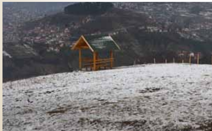
Popov gaj: Postavljene 3 kompletne nadstrešnice sa stolom i dvije klupe