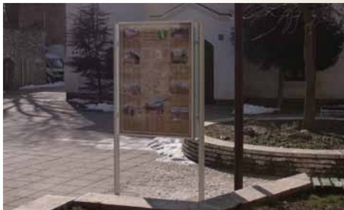
Info pano kod muzeja Jevreja