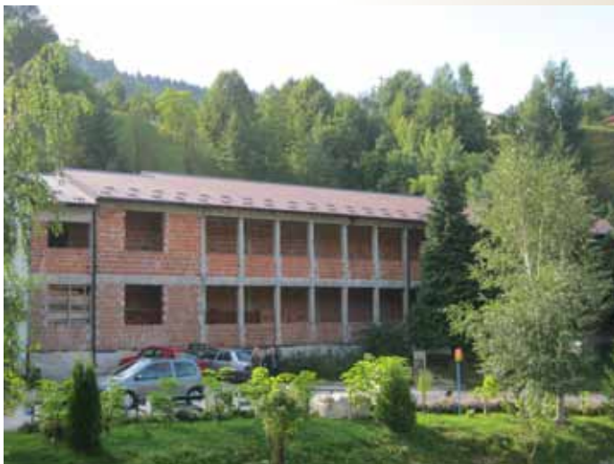
Krov na dograđenom dijelu OŠ „Vrhbosna“

Sanacija fiskulturne sale o OŠ „Vrhbosna“, gdje je usljed poplava početkom godine došlo do velikih oštećenja. Urađen je krov na fiskulturnoj sali i rekonstruisana sala. Vrijednost investicije je cca 70.000,00 KM. Urađen je krov na aneksu (drugom dijelu) škole, vrijednost investicije 54 000 KM.