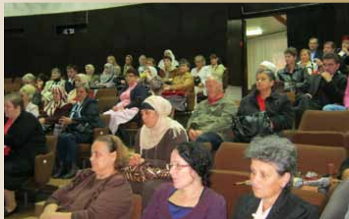
Podjela hedija u povodu ramazanskog bajrama