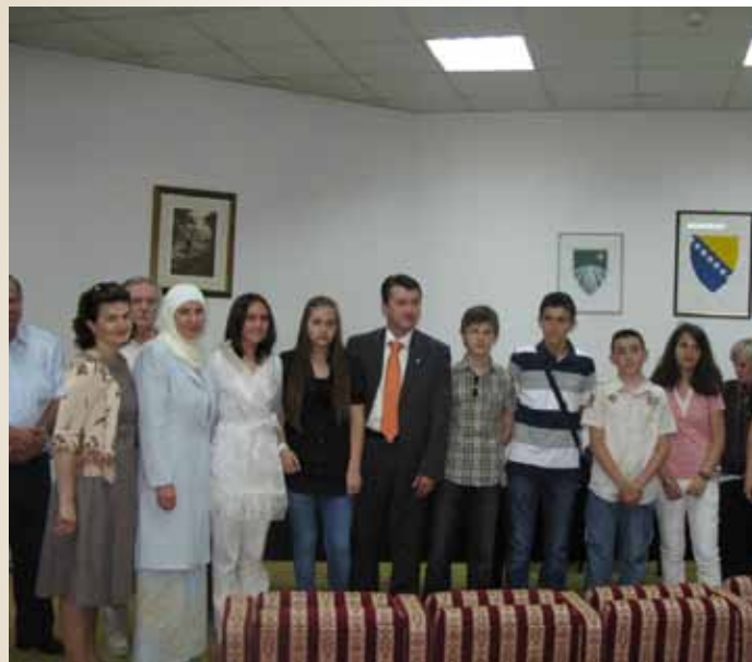
Sa dodjele nagrada učenicima generacije