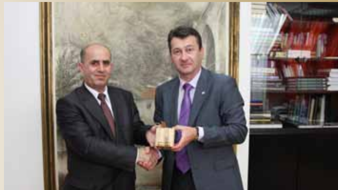
Makedonski Ambasador posjetio načelnika Hadžibarića