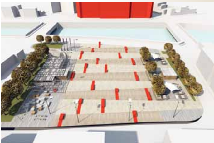
Urbanistički projekat Šahinagića ulica