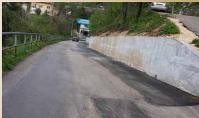
Safvet Bega Bašagića