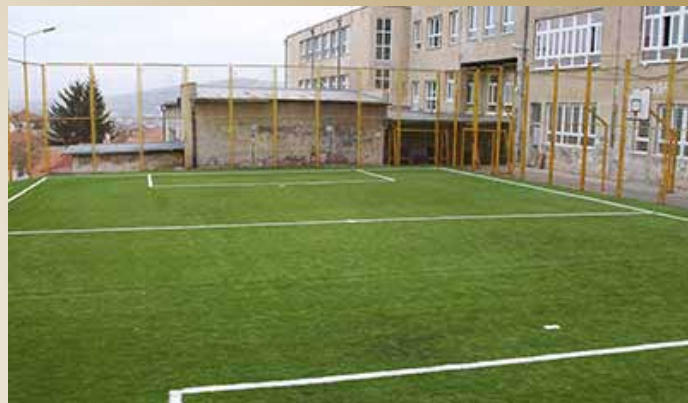
Sportska ploha OŠ „Hamdija Kreševljaković“

Urađena je sanacija sportske plohe OŠ „Hamdija Kreševljaković“, koja je podrazumijevala izvođenje radova na rekonstrukciji postojećeg igrališta sa povećanjem plohe sportskog terena, kao i rušenje starog potpornog zida i izgradnju novog u ulici Carina broj 2. Ukupna vrijednost radova bila je 80.000,00 KM, od čega Općina Stari Grad učestvovala sa 32.000,00 KM i SERDA sa 48.000,00 KM.