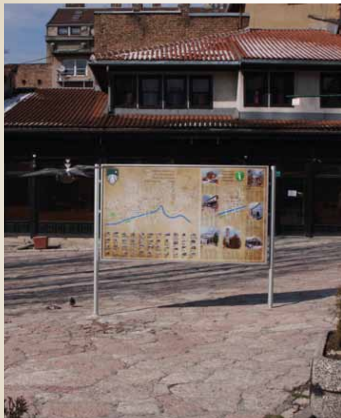
Centralni info pano na Baščaršiji

Info-panoi su projektovani kao prepoznatljiv detalj urbane opreme koji ima za cilj da turistima služi kao pokazatelj u pogledu informisanja i pruži orijentaciju ka karakterističnim mjestima u općini Stari Grad. Info-panoi se nalaze na pet lokacija, a centralni je na Baščaršiji. Ostali panoi, manjih dimenzija, su: iza Katedrale, u parku kod Muzeja Jevreja, kod Latinske ćuprije i kod Šeherehajine ćuprije.