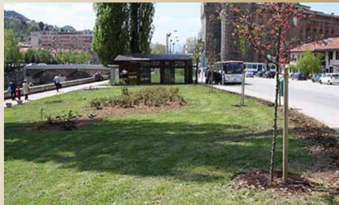
Kod Slovenačke ambasade