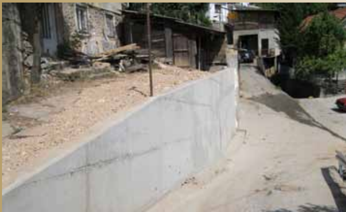
Ramića banja 34