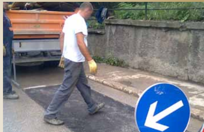
Sanirana rupa u ulici Safvet-bega Bašagića

U planu je izrada Glavnog projekta za sanaciju kompletnog Ramića potoka, koje je ustvari i krajnje rješenje nastalog problema. Vrijednost saniranih radova je 4.500,00 KM, a finansirala ih je Općina Stari Grad.