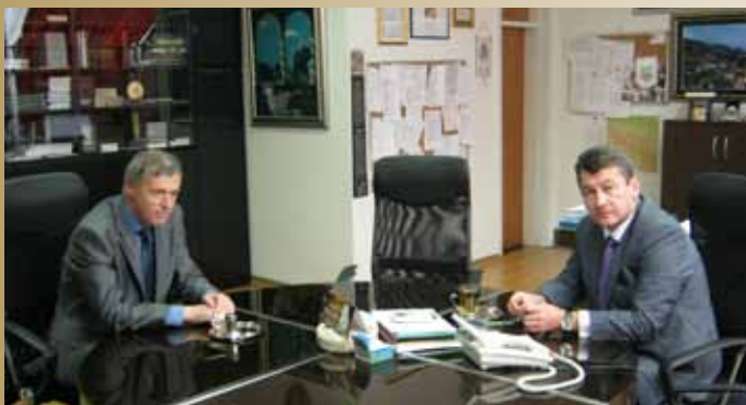
Slovenski Ambasador sa načelnikom Hadžibajrićem