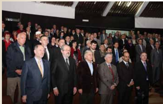
Sjednici su prisustvovali brojni zvaničnici

Svečana sjednica Općinskog vijeća Stari Grad, u povodu 02.maja, Dana Općine, održana je 18.05.2010.godine u velikoj sali Općine, u prisustvu velikog broja uglednih zvanica. Sjednici su, između ostalih prisustvovali: premijer FBiH Mustafa Mujezinović, premijer Kantona Sarajevo Besim Mehmedić, ministar zdrastva Kantona Sarajevo Mustafa Cuplov, delegacija Opštine Budva, te ambasadori i konzuli Pakistana, Saudijske Arabije, Makedonije, Turske i Češke Republike. U kulturno-zabavnom dijelu programa goste su zabavljali Eldin Huseinbegović, Aid Rifatbegović (autor suvenira „Sarajevska kocka“ i pjesme „Sarajevo, stara čaršija“) i KUD „Baščaršija“, a program su vodili Ljiljana Smailbegović i Tarik Helić. Nakon sjednice upriličen je koktel u holu velike sale Općine Stari Grad.