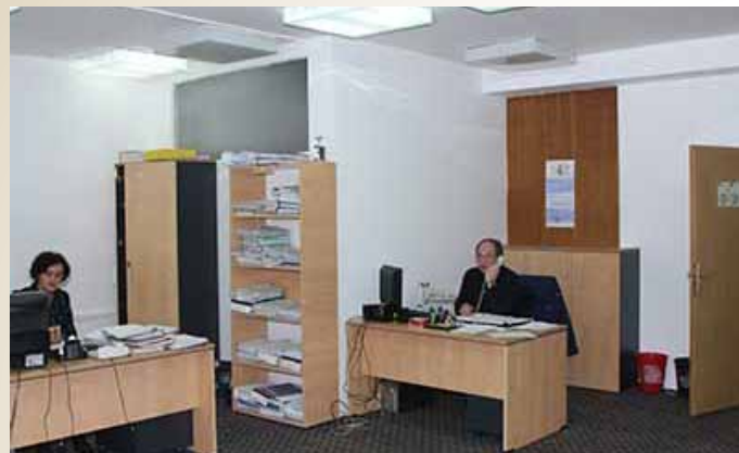
Sanirane općinske prostorije

Za sanaciju, rekonstrukciju i izgradnju javne rasvjete na području Općine Stari Grad dosad je uplaćena prva rata od 40.000,00 KM (ukupna suma je 80.000,00 KM).