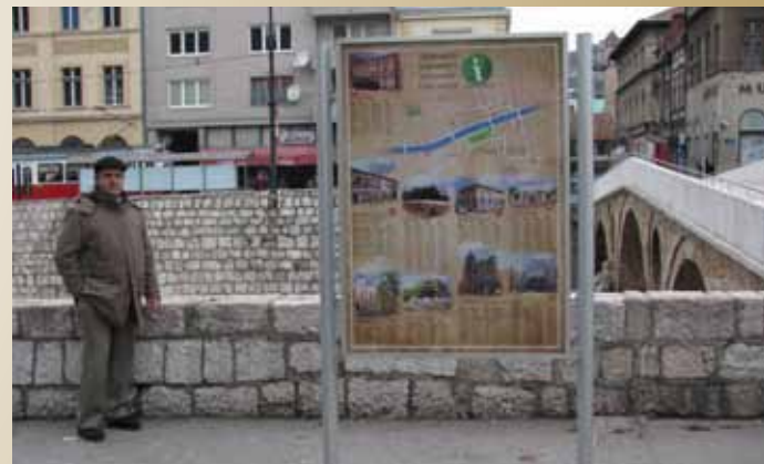
Info pano kod Latinske ćuprije