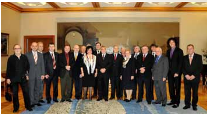
U posjeti predsjedniku Hrvatske Stjepanu Mesiću