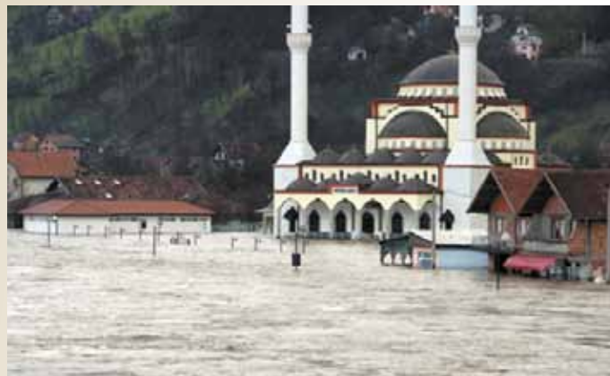
Poplavljena džamija u Goraždu

Općina Stari Grad izdvojila je sredstva od 30.000,00 KM za izgradnju vatrogasnog doma Olovo