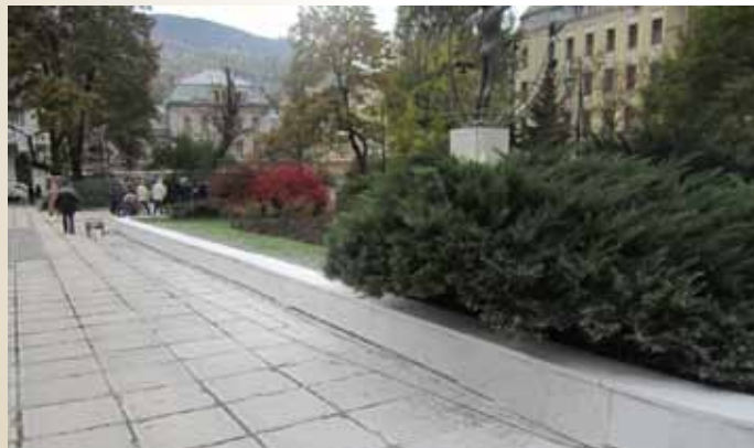
Urađeno poliranje i brušenje kamene obloge